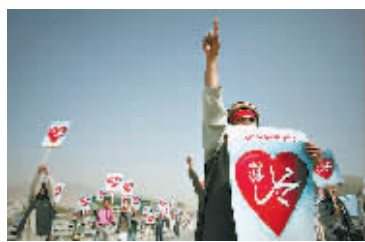
9月20日,民众在阿富汗喀布尔举行示威活动,抗议诋毁伊斯兰教先知的美国影片。 新华社发