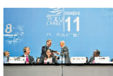
12月16日,世界贸易组织部长级会议正式批准俄罗斯加入世贸组织。