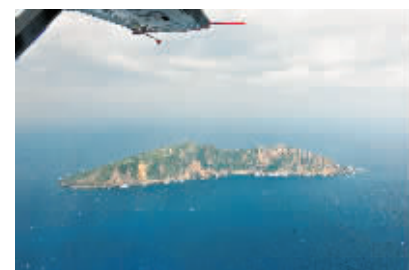
12月13日国家海洋局组织中国海监开展钓鱼岛海空立体巡航,这是从中国海监B-3837飞机上拍摄的钓鱼岛及其附属岛屿画面。