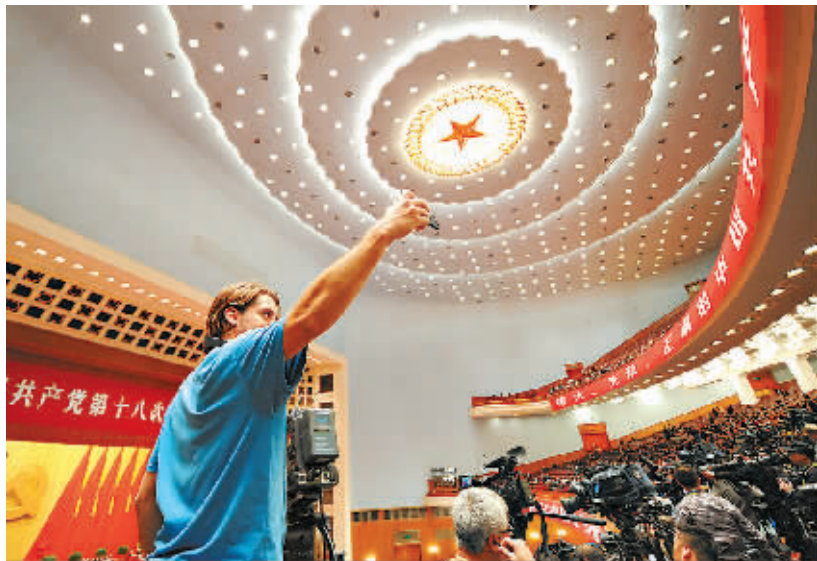
11月8日,中国共产党第十八次全国代表大会在北京隆重开幕,共有2732名中外记者前来采访此次大会。当天恰逢中国记者节。 新华社发

11月8日至14日,中国共产党第十八次全国代表大会在北京举行。大会把科学发展观与马列主义、毛泽东思想、邓小平理论、“三个代表”重要思想一道,确立为党必须长期坚持的指导思想,明确了如期全面建成小康社会奋斗目标,提出五位一体发展思路。会后举行的十八届一中全会选举产生了新一届中央领导集体。