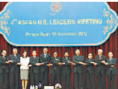
11月19日,在柬埔寨首都金边,美国总统奥巴马(左五)与东盟成员国领导人合影。