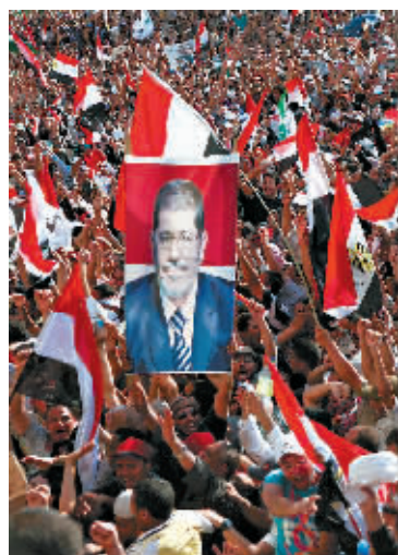
埃及最高总统选举委员会宣布穆尔西赢得总统选举。6月24日,民众庆祝穆尔西获胜。