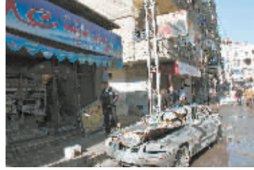
11月28日,叙利亚首都大马士革郊区巴尔马尼地区遭到连环爆炸袭击,造成至少34人死亡、83人受伤。

体。国际社会高度关注,反响积极,普遍认为这是一次具有重要里程碑意义的大会,勾勒出中国未来发展方向,中国新领导层将领导中国继续改革开放,以积极、负责任的大国姿态,在国际社会扮演举足轻重的角色,共同应对全球性挑战,为世界和平发展注入新活力。