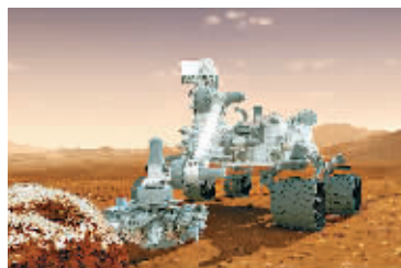
12月4日,美国航天局宣布该机构将借鉴“好奇”号火星车的成功经验,于2020年再次发射火星车。