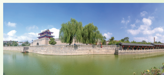
浚县古城景区一角

第一天: 上午前往浚县古城,游览古城墙、端木翰林府、县衙、兵营局、文庙等景点,在古城打卡留影。现在,浚县古城景区还有优惠政策等