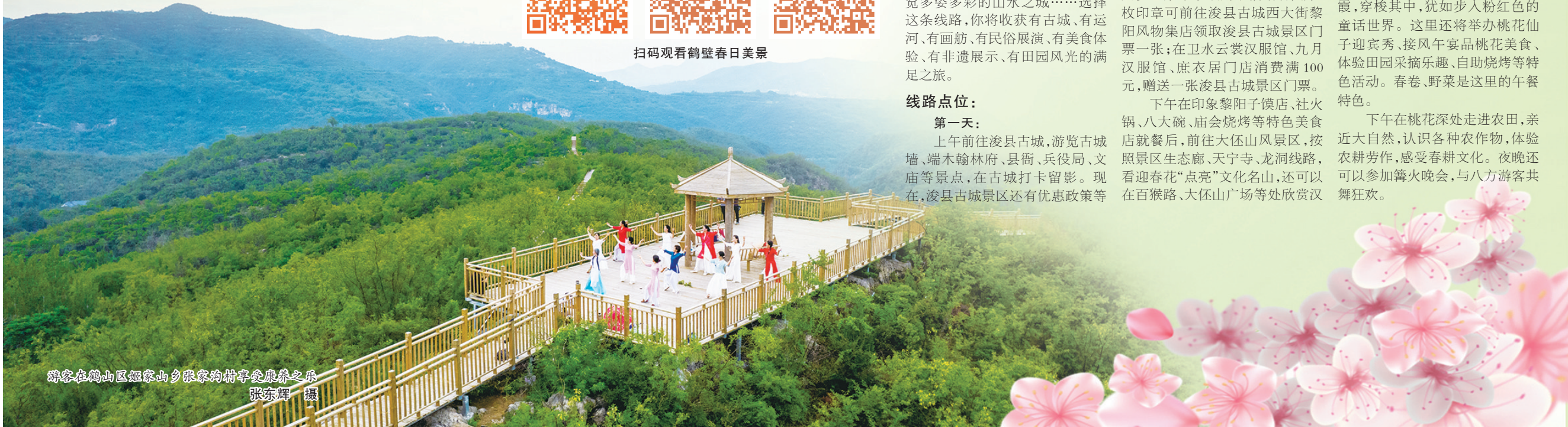
游客在鹤山区姬家山乡张庄村享受康养之乐

下午在桃花深处走进农田,亲近大自然,认识各种农作物,体验农耕劳作,感受春耕文化。夜晚还可以参加篝火晚会,与八方游客共舞狂欢。