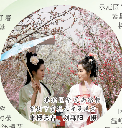
淇滨区华夏南路樱花树下赏花人亦是风景

示范区的淇水樱花园,如繁星点缀在枝头的浪漫樱花,迎着春风摇曳,为同行的她(他)拍一张樱花树下的照片,醉了心头。