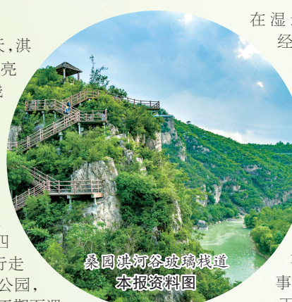
桑园淇河谷玻璃栈道

在湿地游九岛,颂《诗经》、赏春花,到科普馆学习淇河生态知识,到鹤苑与仙鹤亲密接触,学习鸟类养殖知识;到许沟村品尝农家美食,看鹤壁乡村如何美丽逆袭,了解《白蛇传》故事发源地的爱情故事。