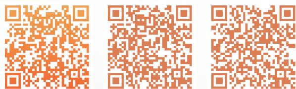
扫码观看鹤壁春日美景