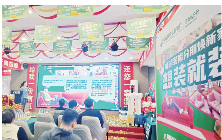
春季家装节活动现场