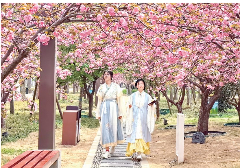
4月7日,淇滨区华夏南路上樱花盛开,游客穿汉服尽情赏花。