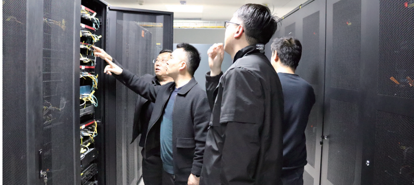
工作人员在排查风险隐患

据了解,国家食品安全示范城市创建督导的首要任务是监督和指导各项食品安全措施的实施,要对食品餐饮单位进行定期检查,检查内容涵盖后厨环境卫生、食品原料的采购、储存、人员健康管理情况等方面。通过全方位监督,及时发现并纠正潜在的食品安全隐患,保障公民的饮食安全。