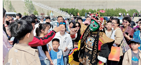
云梦山景区互动式演出深受欢迎

本报讯 (记者 王玉姣 通讯员 田娟)淇县朝歌老街游人如织,尽显蓬勃生机;在云梦山景区,古军事文化活动令人心潮澎湃;在朝阳山景区,非遗绝活儿引来阵阵叫好声;在金牛岭郊野公园,风光如画……“五一”假期,淇县文旅集团旗下景区活力四射、各具亮点。