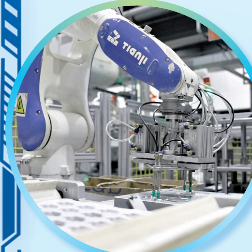
鹤壁耕德电子有限公司生产车间内机械臂忙碌工作