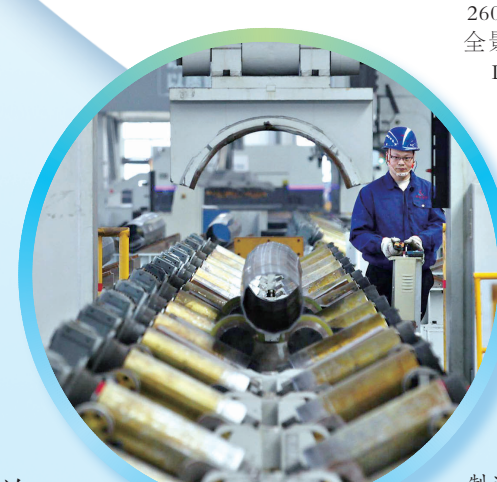
河南垂天智能制造有限公司工人在加工智能杆

朝歌风华项目主题之一,是一个大型行进式交互体验馆,依附殷商、封神文化,通过环境渲染、场景打造、内容IP等科技手段,让参与者在虚拟空间中获得感官震撼和情绪共鸣,打造具有高雅认度的国风文化沉浸式体验剧。