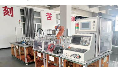
智能生产线安装与运维车间