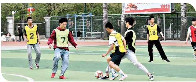
丰富多彩的校园生活