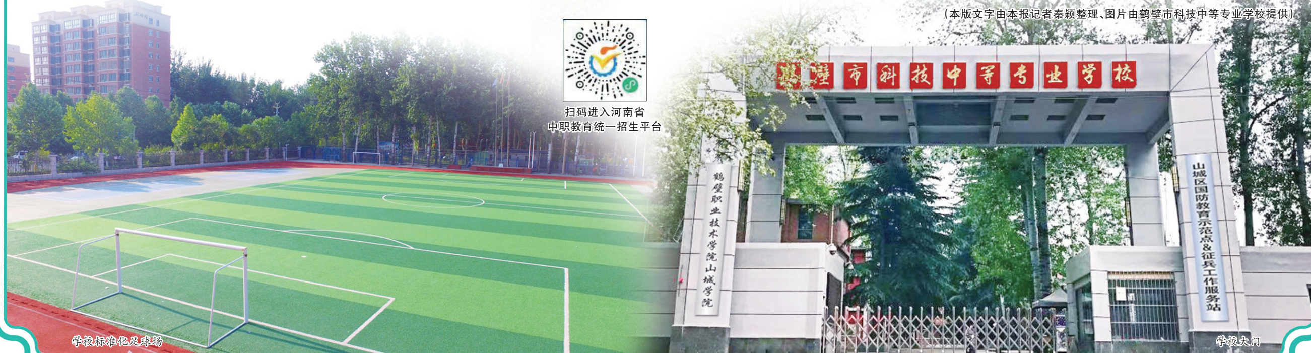
学校标准化足球场