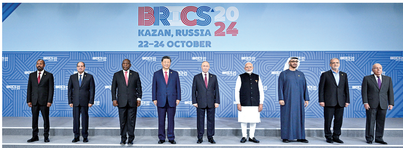
当地时间10月23日上午,金砖国家领导人第十六次会晤在喀山会展中心举行。俄罗斯总统普京主持会晤。中国国家主席习近平、巴西总统卢拉(线上)、埃及总统塞西、埃塞俄比亚总理阿比、印度总理莫迪、伊朗总统佩泽希齐扬、南非总统拉马福萨、阿联酋总统穆罕默德等出席。这是会晤期间,金砖国家领导人集体合影。