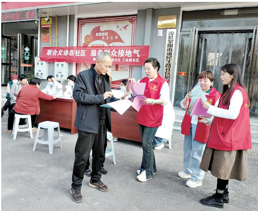
民生路社区联合其他社区开展义诊,并普及健康知识。