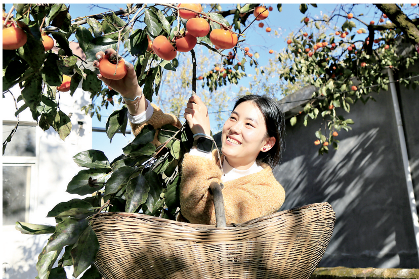
10月23日,河南省洛阳市汝阳县王坪乡两河村村民在采摘柿子。当日是秋季的最后一个节气霜降,农民抢抓农时在田间地头忙收获、秋管等工作。

光医学专业,对应考试专业为眼科学。在乡镇卫生院、社区卫生服务中心累计工作满25年的执业医师,符合申报条件且高级职称业务考试合格,不受单位岗位结构比例限制通过“绿色通道”申报乡镇社区副主任医师;取得中级职称后继续在农村基层医疗卫生机构(乡镇卫生院或村卫生室)服务,连续聘任满10年且高级职称业务考试合格,不受单位岗位结构比例限制通过“绿色通道”申报乡镇社区副主任医师。