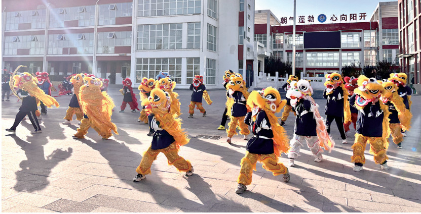
学生们进行舞狮表演

本报讯（见习记者 王灏 通讯员 张晓）为全面贯彻党的教育方针，落实立德树人根本任务，不断推进“双减”政策落实，强化学校体育育人功能，近日，淇县教育体育局组织全县各中小学开展了“最美大课间”展示活动。 各中小学高度重视、积极筹备，结合学校体育特色展示了跑步、韵律操、武术操、篮球操、腰鼓、竹竿舞、花棒舞、跳皮筋、舞狮等形式多样、生动有趣的体育活动。在操场上，学生们朝气蓬勃的身影、铿锵有力的步伐、活力四射