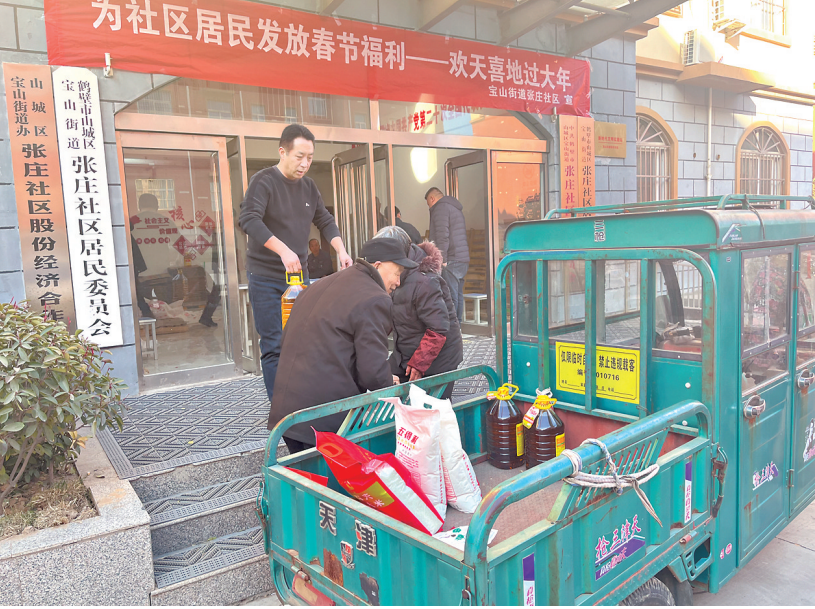
福利发放现场

本报讯（记者 张婷媛 通讯员 武海燕）新春将至，为了让辖区居民度过一个温馨的佳节，近日，山城区宝山街道各社区为居民发放过节福利。