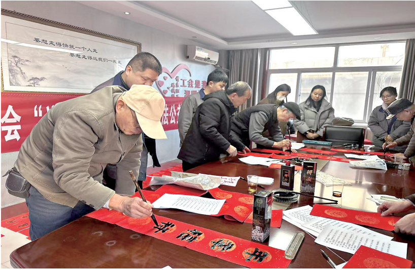
活动现场

1月14日上午，胡峰社区熙熙攘攘，人潮攒动、热闹非凡，男女老少有的推着三轮车、有的骑着电动车、有的开着汽车，络绎不绝地来领取春节福利。“每人白面40斤、大米20斤、小米10斤、挂面10斤、花生油1桶，核对一下，可别漏了。”社区居委会工作人员一边和居民笑谈打趣，一边组织居民有序签