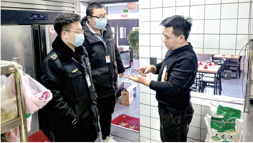
专项检查现场

本报讯（记者 王凤侠 通讯员 新洪杨）春节将至，为保障人民群众饮食安全，近日，市市场监管局示范区分局开展“守护年夜饭”食品安全专项检查行动，以强有力举措严守食品入口关，全力守护市民的新春“团圆味”。