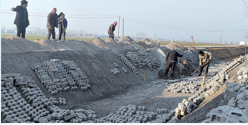
淇滨区国家级农村综合性改革试点试验项目建设一角。

村工作走在我市乃至全省前列。依托数字乡村运营中心项目,优化“13596”运营模式,在基础设施、农业生产、乡村治理等领域,加快实现数字化全领域应用,深入推进数字化转型;“数字化”在乡村治理中的红利持续释放,激活了乡村振兴一池春水。