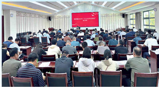
2024年7月,钜桥镇组织开展党员进党校培训,提升党员干部能力水平。

旗帜引领方向,党建凝聚力量。钜桥镇始终把党的建设摆在首位,以网格化治理延伸触角,探索“党建+网格化管理”新型基层治理模式,用小网格构筑起基层治理大格局,新时代“枫桥经验”、五步解纷法运用更加充分,治理成效更加明显。