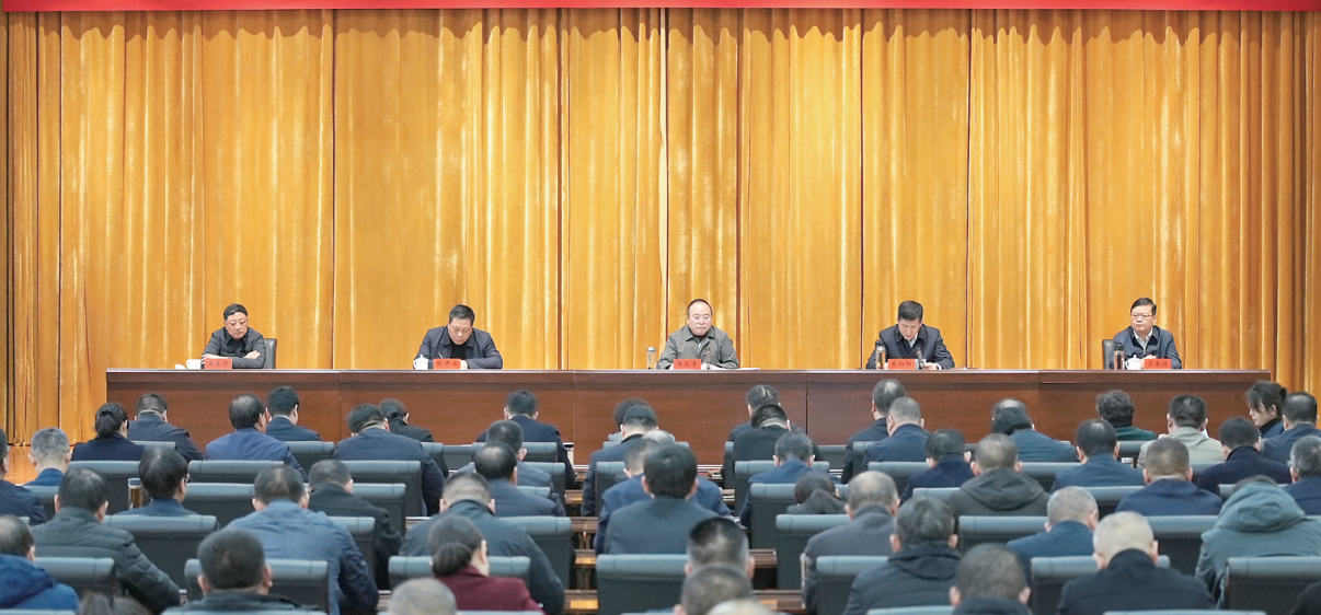
2025年2月28日,市委政法工作会议召开。