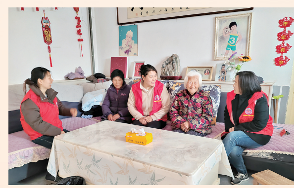
2024年4月2日,淇县西岗镇“小帮”帮帮团入户走访。

“行动是最有力的宣言,落实是最有效的担当。在下一步工作中,我们将以‘起步即冲刺、开局即决战’的状态,全面落实省委‘四高四争先’要求,紧盯市委‘十个聚焦’工作部署,干字当头,挺膺担当,以更高政治站位、更强责任担当、更实工作举措,推动政法改革进一步向深度和广度进军,推动各方面制度机制更加成熟定型,推动各项任务务落实落地,努力开创鹤壁政法工作现代化新局面,奋力推动平安鹤壁、法治鹤壁建设迈上新台阶、收获新荣光,向再创‘平安中国建设示范市’、三夺‘长安杯’发起冲锋,为谱写中国式现代化鹤壁篇章做出新的更大贡献。”市委常委、政法委书记王永青说。