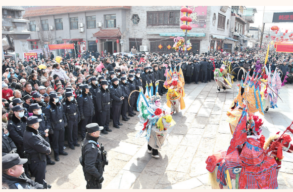
2025年2月6日,浚县公安局民警辅警在正月庙会现场执勤。

任制为抓手,全力打造了主动维稳工作新格局,特别是在正月古庙会等大型活动的安保维稳工作中表现突出,牢牢守住了全市安全稳定的“东大门”;淇县持续擦亮平安建设品牌,连续11年荣获全省平安建设工作优秀奖,并向着再获“平安中国建设示范县”、首夺“长安杯”发起了强力冲刺;淇滨区作为主城核心区,强化了政法