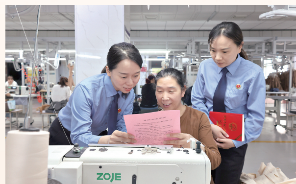
2024年5月11日,检察官结合典型案例为女职工讲解关于妇女权益保护的法律知识,引导她们运用法律武器维护自身合法权益。

过去的一年,全市政法系统脚跟站稳、对正看齐,对党忠诚的本色更加鲜明。始终坚持用习近平新时代中国特色社会主义思想凝心铸魂,以党的旗帜为旗帜,以党的方向为方向,以党的意志为意志,坚定不移地走中国特色社会主义法治道路。