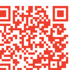
扫码了解4宗优质地块详情

据了解,此次推介会推介的4宗优质地块分别位于淇滨区(2宗)、市城一体化示范区(2宗),区位优势明显,配套规划完善,开发潜力很大。