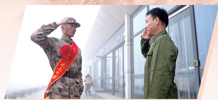
父子相互敬礼,两代军人的无声传承。

市政府党组成员、市公安局局长刘海在致欢送词时,向光荣入伍的新战士表示热烈祝贺,向积极送子参军、支持国防建设的家长致以崇高敬意。他寄语新兵,要在强军兴军中建功立业,不负重托、不辱使命,用热血和汗水锻造过硬本领,用智慧和担当谱写国防建设壮丽篇章;要在军队熔炉中淬火成钢,努力学习、积极向上,不怕苦累、严守纪律,做新时代“四有”军人。