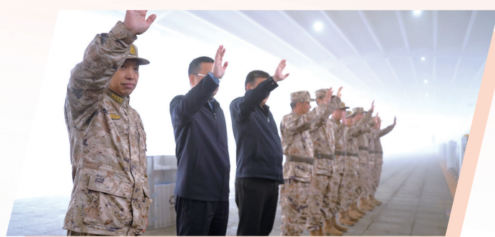
军地领导向新兵挥手作别。