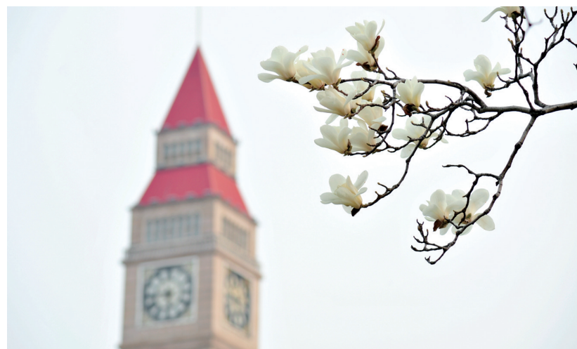
进入春季,我市各类花卉竞相开放,早樱、玉兰等目前进入盛花期,花团锦簇、姹紫嫣红,把城市装点得分外美丽。图为记者3月17日在新世纪广场拍摄的玉兰花,凝脂如玉的花朵与广场钟楼相映成趣。

双方同意,研究建立促进双边贸易投资的合作机制,继续发挥好中美经贸磋商机制作用,加强对话沟通,妥善管控分歧,拓展务实合作,推动双边经贸关系持续稳定向好。