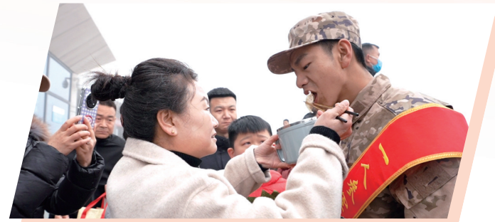
临行前的饺子,母亲喂进嘴里,嘱托藏在心里。

据悉,自今年春季征兵工作启动以来,鹤壁市广大适龄青年积极响应祖国号召,踊跃报名参军。经过严格体检、政治考核和择优定兵等环节,一批政治素质过硬、身体条件优良的青年脱颖而出,光荣入伍。