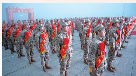
站前广场中央,身着崭新迷彩服、胸前佩戴大红花的新兵整齐列队,英姿挺拔、眼神坚定。