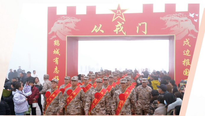
全体新兵通过象征着光荣与责任的“从戎门”。

本报讯(记者 马梅雪)长风万里,戎装待发。3月17日清晨,鹤壁东站站前广场上军歌嘹亮、誓言铿锵,鹤壁市2026年春季新兵欢送大会在此隆重举行。又一批鹤壁优秀青年,带着家乡父老的殷切期望和报效祖国的赤子之心,从这里出发,奔赴火热军营,开启保家卫国的光荣征程。