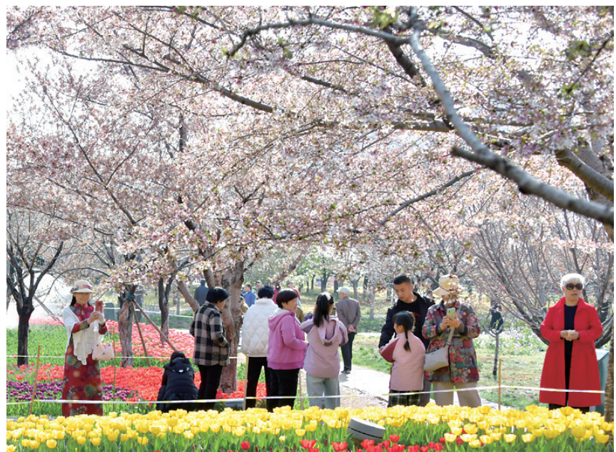
游客在樱花园赏花

开幕式后,市文广旅局推出品牌文化专场演出,以精品演艺串联鹤城樱花盛景、诗经文脉与人文风情。舞蹈《樱舞鹤壁》将樱花的柔美灵动与鹤城的典雅气质深度融合,现场观众“一秒入景”;《诗韵淇畔》聚焦鹤壁满城樱花特色与诗经文化底蕴,在舞蹈中融入诗经名句诵读,带来古今碰撞的视觉盛宴;相声《趣逛鹤壁》以幽默诙谐的方式成为现场的