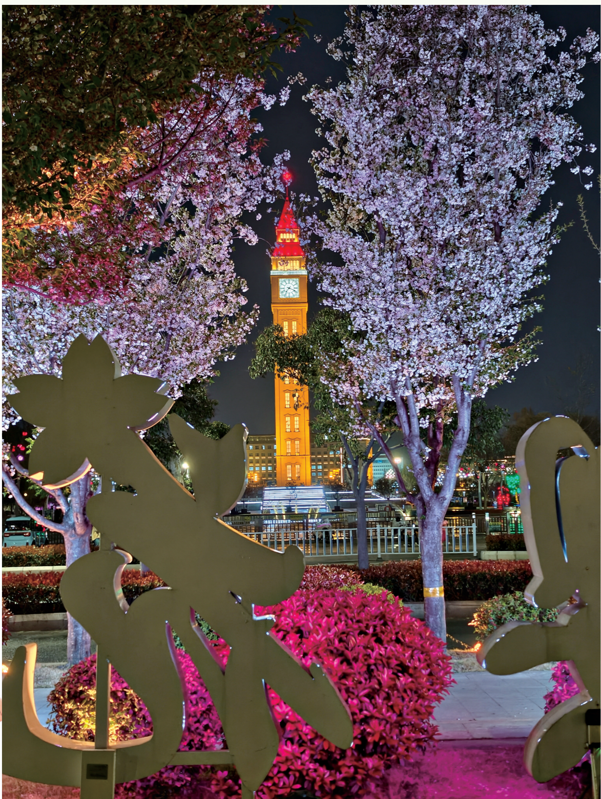
夜幕下的“中国最美樱花大道”淇滨区华夏南路繁花似锦、灯火璀璨,尽显鹤壁春日文旅新风貌。