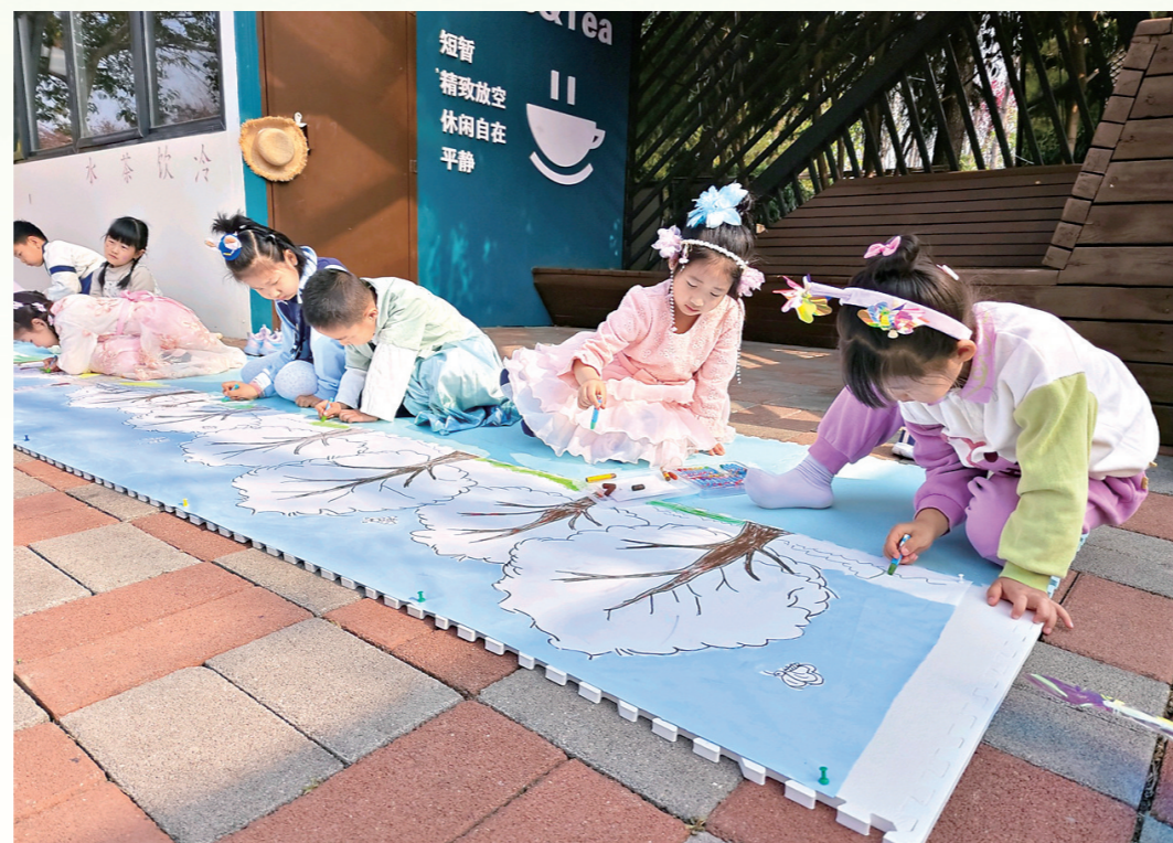
4月2日,2026樱花季鹤壁文旅推介大会“诗画鹤城”绘画表演在淇滨区桃园公园举行,小朋友们专注创作,用稚嫩笔触勾勒春日浪漫,为文旅盛会注入纯真童趣。