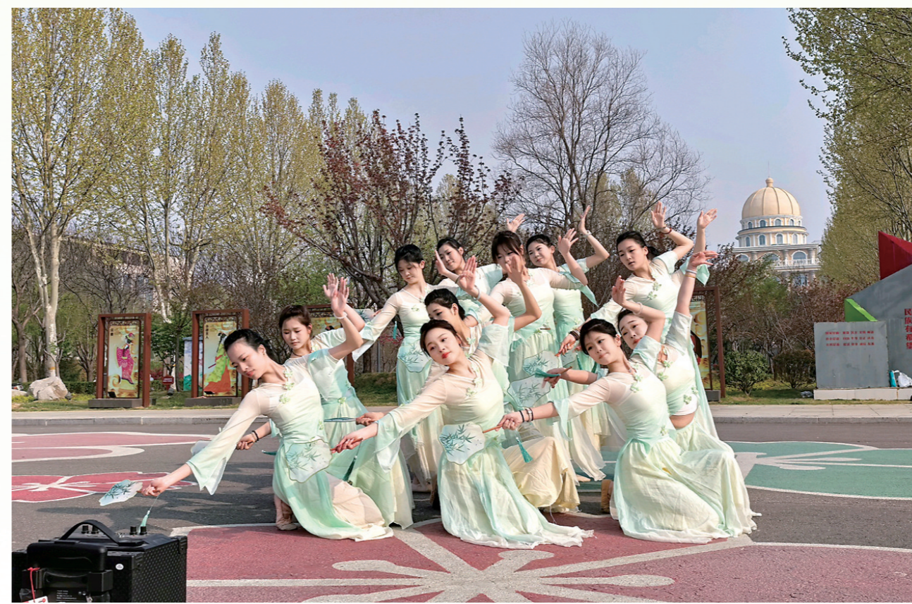
4月2日上午,古典舞《清风徐来》表演团队在淇滨区华夏南路与漓江路交叉口的表演点位上排练。