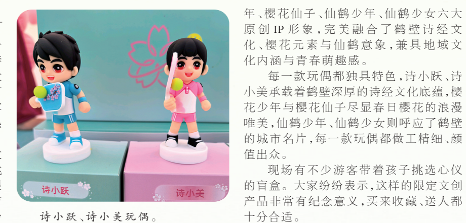
诗小跃、诗小美玩偶。

文创展示区域摆放着多款造型别致的盲盒玩偶,吸引了不少游客驻足挑选、开箱体验。鹤壁诗河文旅发展有限公司工作人员介绍,这款樱花季专属盲盒,精心设计了诗小跃、诗小美、樱花少