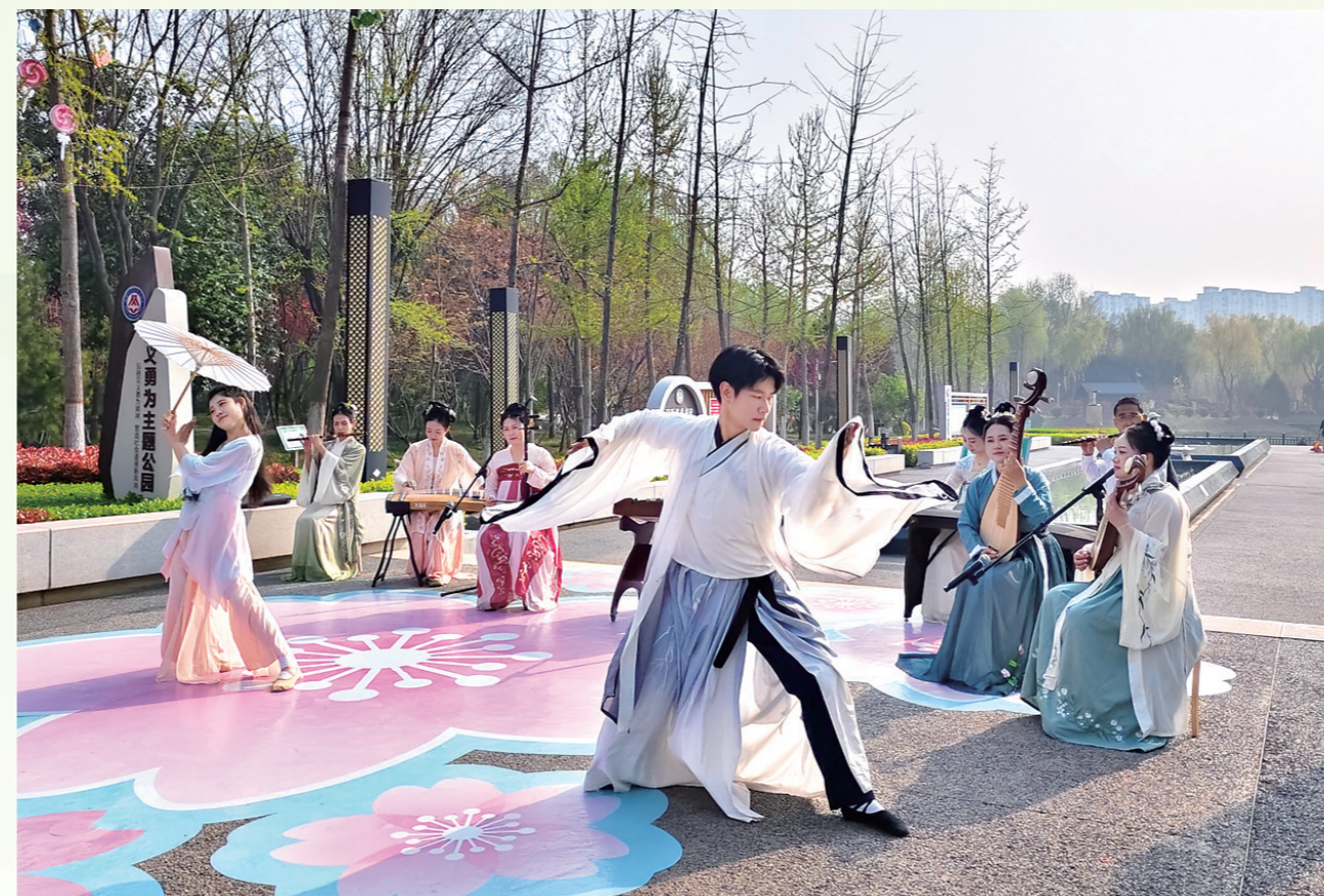
4月2日,双人舞《立春》在淇滨区桃园公园精彩上演。两位专业舞者身着融合樱花元素的服饰,在古典音乐的伴奏下翩然起舞,舞姿柔美舒展,生动勾勒出春回大地、万物复苏的诗意画卷,赢得现场观众阵阵掌声。 几位伴奏者身着古装,以古筝、琵琶、古琴、二胡、笛子等传统乐器为舞蹈伴奏,丝竹声声与落英缤纷相映成趣,生动展现了中华优秀传统文化的独特韵味,引得众多游客驻足欣赏、拍照留念。