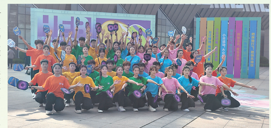
4月2日,2026河南鹤壁樱花季“卓星杯”匹克球城市邀请赛的赛场上,鹤壁汽车工程职业学院50名学生带来匹克球主题啦啦操表演。

多彩的身姿、动感的表演吸引不少过往市民驻足围观,大家纷纷拿出手机,定格这一青春满满的精彩瞬间。