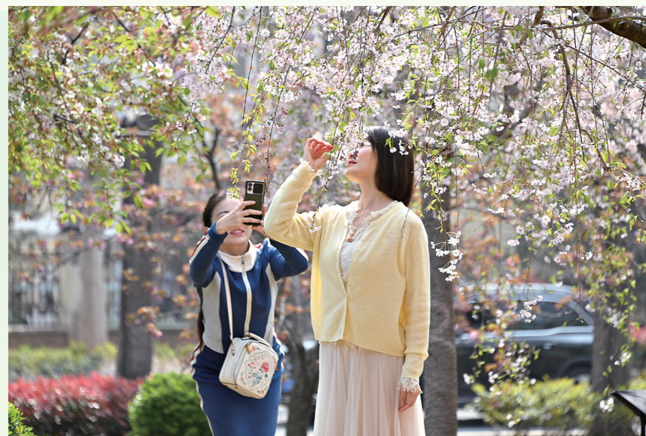
作为北方知名赏樱胜地,鹤壁以满城樱花为媒,向全国各地发出春日之约。全市87个品种、30余万株樱花次第绽放,绵延4公里的淇滨区华夏南路被誉为“中国最美樱花大道”,2.2万株名品樱花如云似雪、蔚然成海。淇滨区二支渠畔、桃园公园、天香水街等多处赏樱点位串珠成链,一步一景、步步生花,形成“全城赏樱、全城如画”的生态景观格局。