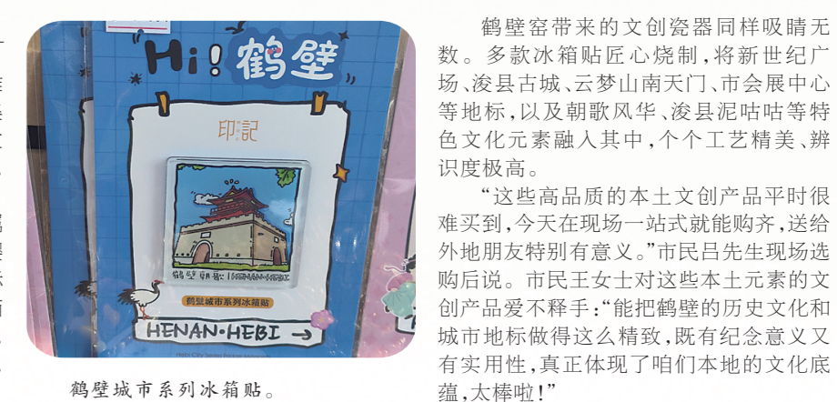
鹤壁城市系列冰箱贴。

淇县朝歌老街朝歌造物文创店备受瞩目。展台上,双层创意扇融入人文景观、淇县等地元素,设计精巧;印有朝歌老街特色的水杯,造型别致的灯具、金属风车冰箱贴、樱花主题小镜子等文创好物琳琅满目,做工精细、颜值出众,吸引不少游客下单,购买热情高涨。