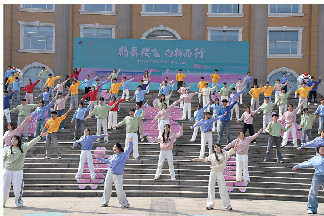
4月2日上午,2026樱花季鹤壁文旅推介大会街舞秀在青少年宫广场上演,160多名演员凭借整齐的舞步与饱满的活力瞬间点燃现场氛围,为这场文旅盛会再添潮流色彩。