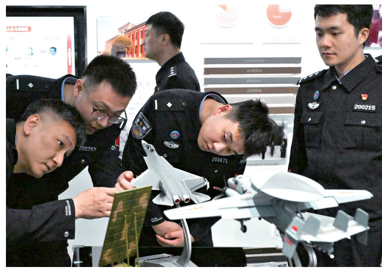
4月14日，南京出入境边防检查站的民警在江苏省南京市全国国家安全教育基地参观。

根据通知要求，各地商务主管部门和进出口银行各行要强化政策衔接、工作对接和信息共享，在符合世贸组织规则前提下，探索强化财政金融与商务协同效应，聚焦外贸主体、进出口环节、产供应链国际合作等，提供更加精准、高效、有力的金融服务。