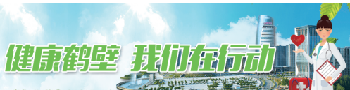
健康鹤壁 我们在行动

温馨提示：如果症状反复或加重，一定要及时就医，别让大问题变成大麻烦。(市疾控中心李会然供稿)