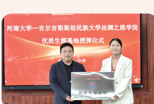
“优质生源基地”授牌仪式现场