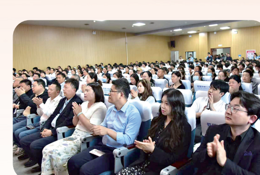
人文交流活动现场

为拓宽学生成长路径,培养具有跨文化沟通能力的新时代人才,4月18日,鹤壁市第一中学开展丰富多彩人文交流活动。来自国际院校招生代表,北京外国语大学、河南大学等国内知名高校专家学者,以及学校师生、家长代表,探讨教育国际合作新路径,探索多样化人才培养新模式,全面展示了学校在特色化、多样化办学方面取得的扎实成效与开放包容的育人风貌。