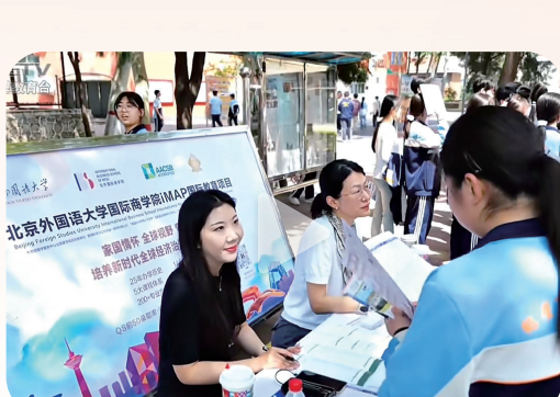
北京外国语大学招生代表与学生交流